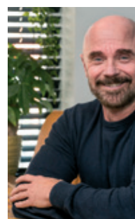
Wij zitten voor je klaar!

Ook wordt er een eerste opzet voor een sollicitatiebrief gemaakt. En kan er geoefend worden op het voeren van een sollicitatiegesprek, bijvoorbeeld in de vorm van rollenspellen.